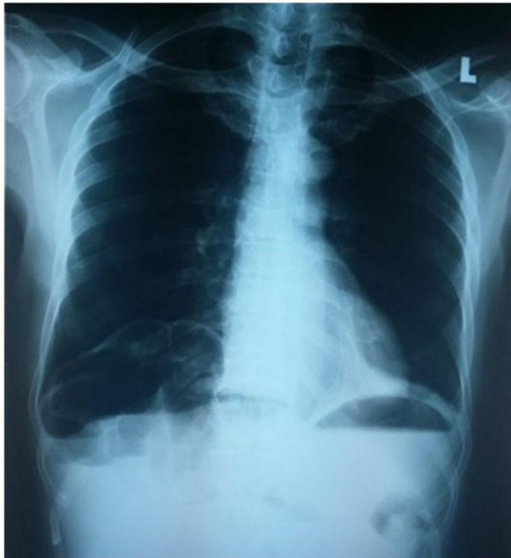
Figura 1. Rayos x de tórax que muestra aire debajo del hemidiafragma derecho

Se indicó tomografía de tórax y abdomen, donde llamaba la atención la interposición de varias imágenes aéreas compatibles con asas