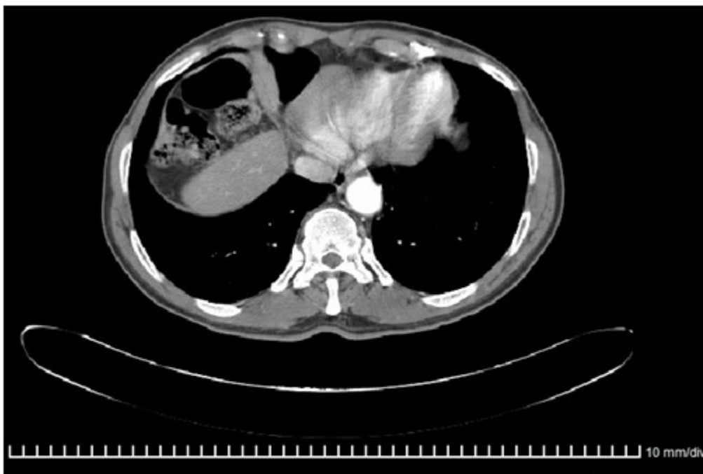
Figura 2. TAC de tórax que muestra asas de colon que se interponen entre el hígado y el hemidiafragma derecho

El paciente fue tratado con un manejo conservador, con suspensión de la vía oral por 6 horas, colocación de sonda nasogástrica, se corrigieron los trastornos del medio interno con soluciones parenterales, se le administraron analgésicos y laxantes y los síntomas se resolvieron sin necesidad de cirugía.