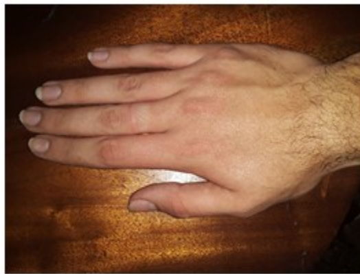
Figura 1. Dedos largos