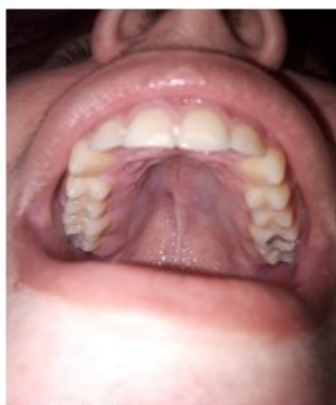
Figura 5. Paladar ojiva