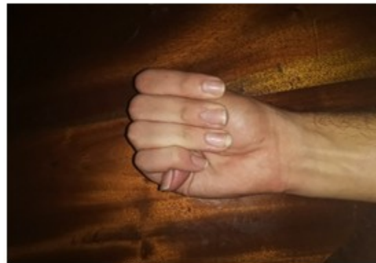
Figura 4. Signo del pulgar positivo