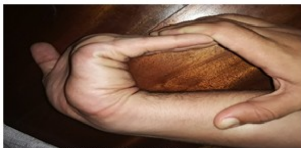
Figura 9. Flexibilidad de la muñeca