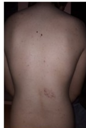
Figura 6. Estrías y hemangioma en espalda