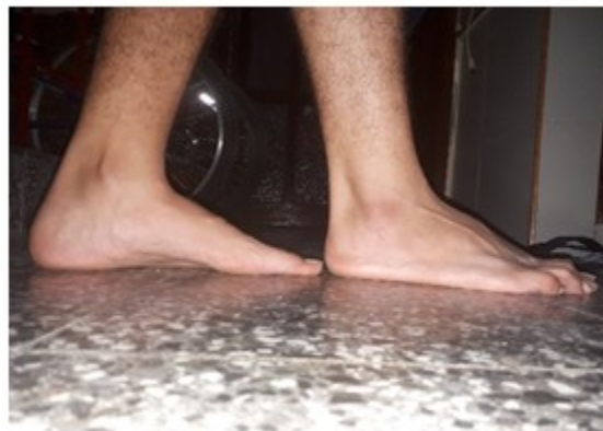
Figura 2. Pie plano