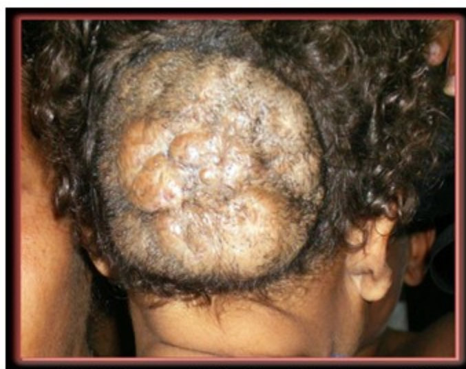
Figura 3. Edad: 18 meses. Calcificación multilobulada en polo inferior. Polo superior y porción media, ya existen adherencias

Sin la presencia de manifestaciones clínicas neurológicas ni de otros órganos y sistemas. (Figura 3).