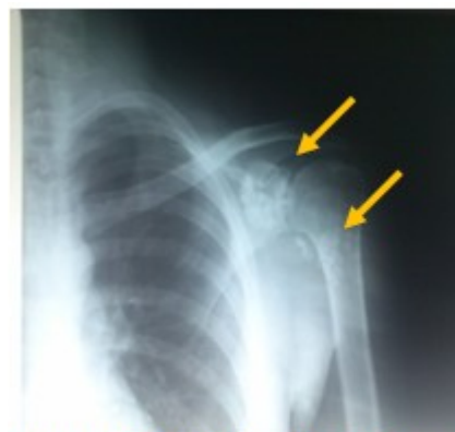
Figura 1. Radiografía simple del hombro izquierdo

Se trata de un paciente de sexo masculino, de 20 años, que luego de realizar ejercicios físicos sistemáticos comenzó con aumento de volumen y limitación de movimientos a nivel del hombro izquierdo, acudió al ortopédico y se le realizó examen físico y rayos X del hombro, que mostraron múltiples pequeños cuerpos libres opacos en la proyección de la articulación glenohumeral y subhumeral. (Figura 1).