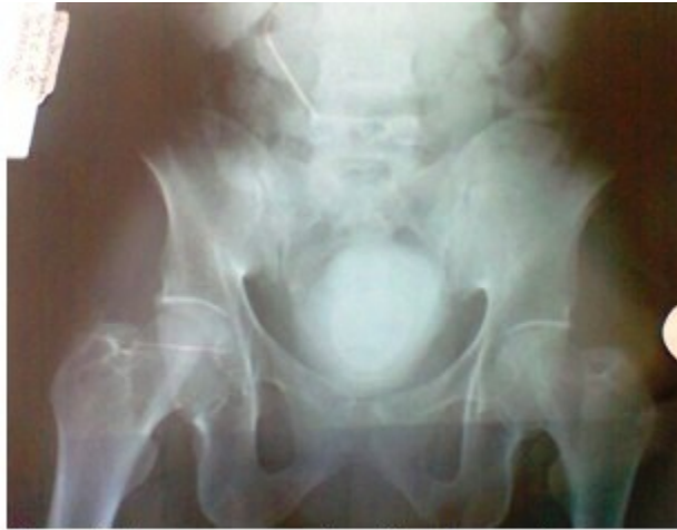
Figura 1. Imagen que muestra vejiga de porcelana

Examen da orina: positivo, en el que se observaron huevos de Schistosomas . (Figura 2).