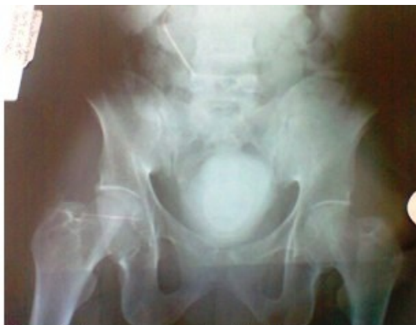
Figura 1. Imagen que muestra vejiga de porcelana

Examen da orina: positivo, en el que se observaron huevos de Schistosomas . (Figura 2).