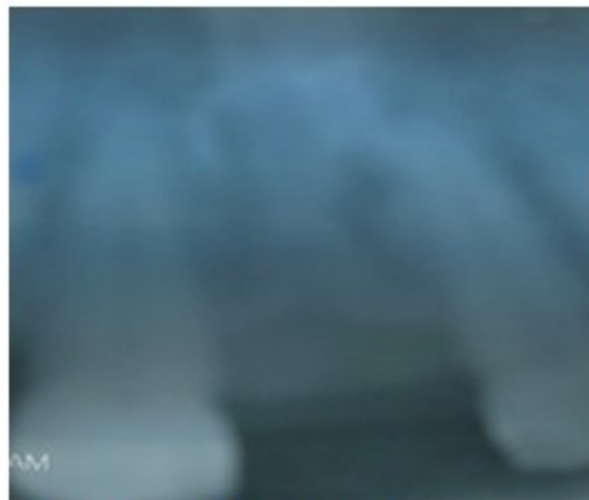
Figura 4. Rayos X periapical

llegaba hasta el límite entre el tercio medio y el tercio apical del 11 y el 21. Diastema de más de 9 milímetros. (Figura 4).