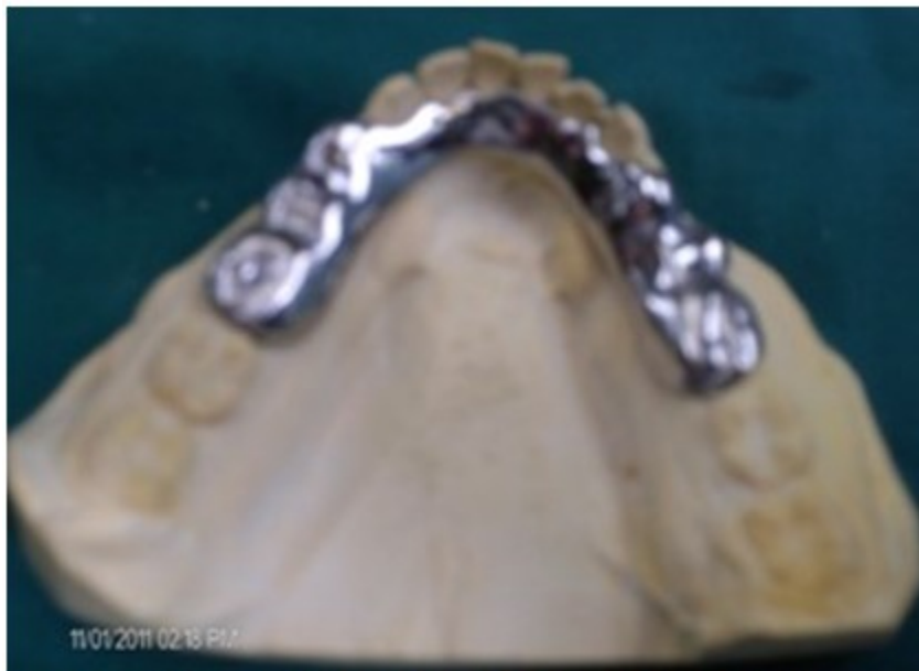
Figura 7. Férula metálica en forma de placoide linguolaminar

La presencia de múltiples torus mandibulares impidió la confección de un levante de mordida convencional de acrílico y se diseñó entonces un conector mayor en forma de placoide linguolaminar que nos permitió unir los dos bloques de acrílico para el levante en el sector posteroinferior. (Figura 7).