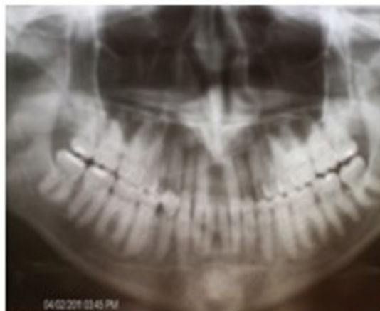
Figura 6. Rayos X panorámica

paciente. No se observaron procesos patológicos radiculares, trabeculado óseo reforzado. Línea media particularmente engrosada con reforzamiento óseo del rafe medio muy marcado. Diastema coronario y radicular de más de 9 milímetros. (Figura 6).