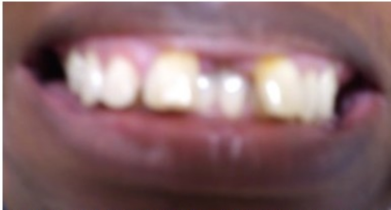
Figura 1. Diastema central superior de 9mm, sobrepase de corona completa. Foto de la paciente al llegar a consulta

morfología de consistencia duroelástica, difusa a nivel de 11 y 21. Estaban presentes todos los dientes permanentes, observándose gresiones y rotaciones dentarias, había vestibuloversión de los incisivos superiores y un diastema central superior de más de 9 mm. La curva de Spee estaba aumentada. (Figura 1).