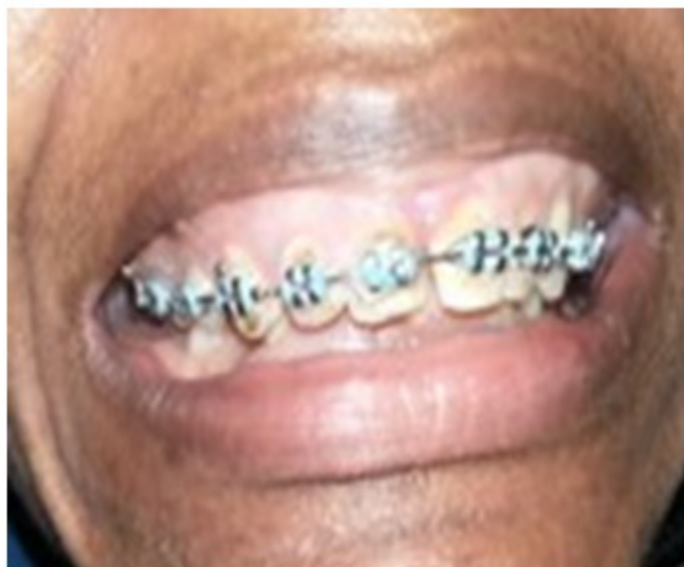
Figura 10. Aparatología fija utilizada en el tratamiento ortodóncico