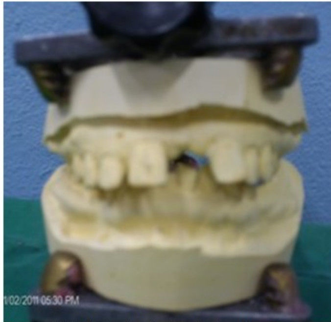
Figura 3. Modelos de estudio relacionados

Al realizar rayos x periapical se observó un engrosamiento marcado del rafe medio que