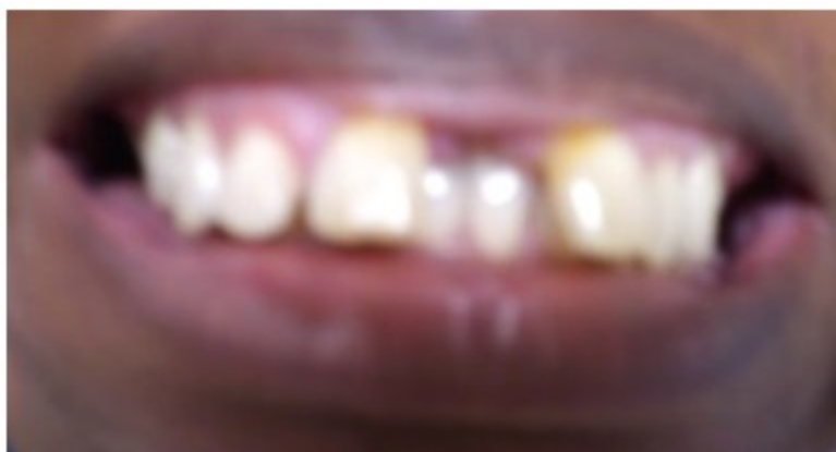
Figura 1. Diastema central superior de 9mm, sobrepase de corona completa. Foto de la paciente al llegar a consulta

morfología de consistencia duroelástica, difusa a nivel de 11 y 21. Estaban presentes todos los dientes permanentes, observándose gresiones y rotaciones dentarias, había vestibuloversión de los incisivos superiores y un diastema central superior de más de 9 mm. La curva de Spee estaba aumentada. (Figura 1).