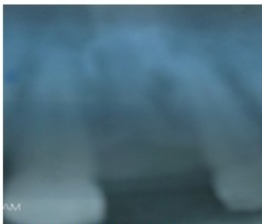
Figura 4. Rayos X periapical

llegaba hasta el límite entre el tercio medio y el tercio apical del 11 y el 21. Diastema de más de 9 milímetros. (Figura 4).