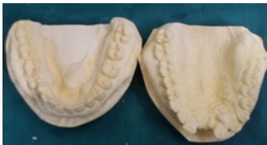
Figura 2. Modelos de estudio que muestran las exostosis óseas y los torus mandibulares

estudio se observó macrognatismo transversal y discrepancia hueso diente positiva. (Figura 2).