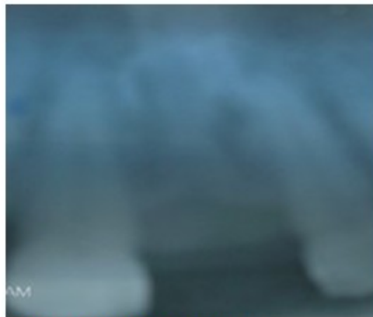
Figura 4. Rayos X periapical

llegaba hasta el límite entre el tercio medio y el tercio apical del 11 y el 21. Diastema de más de 9 milímetros. (Figura 4).