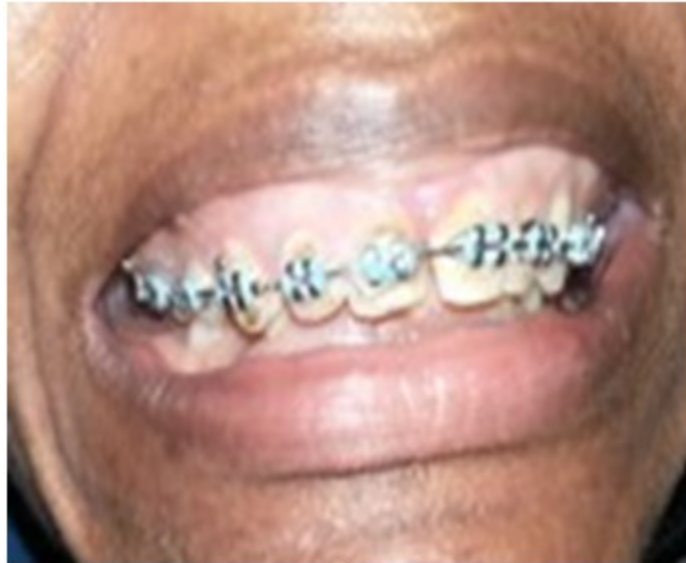
Figura 10. Aparatología fija utilizada en el tratamiento ortodóncico