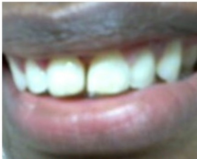
Figura 11. Diastema central de 1mm, luego de cumplimentar el tratamiento ortodóncico y el cierre de diastema con resina fotopolimerizable.

Una vez logrado el cierre del diastema se le indicó a la paciente la utilización de un aparato removible tipo Hawley, de contención, por un tiempo comprendido de entre 3 a 5 años para evitar cualquier recidiva, no sin antes advertirle sobre las medidas higiénicas para mantener su