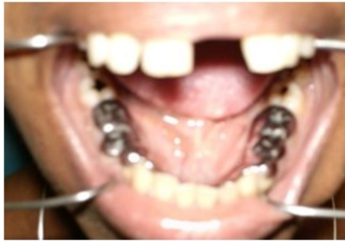
Figura 8. Instalación de la férula metálica para levante de mordida

días hasta que la paciente estuvo recuperada para comenzar así el tratamiento ortodóncico. (Figuras 8 y 9).