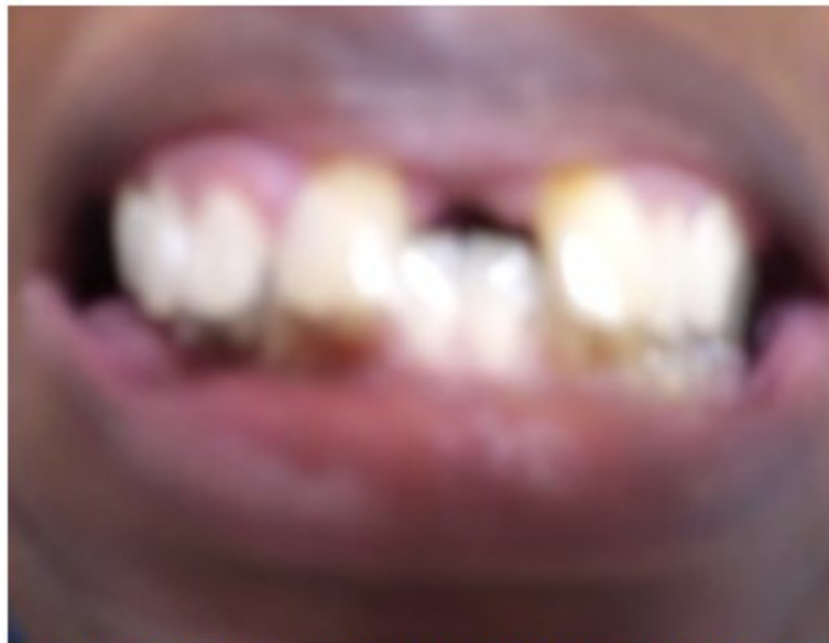
Figura 9. Se muestra el levante de mordida logrado con la férula metálica instalada luego de la cirugía periodontal

Se colocó aparatología fija para mejorar el sobrepase y cerrar el diastema central, el cual disminuyó hasta 4 milímetros en un periodo de