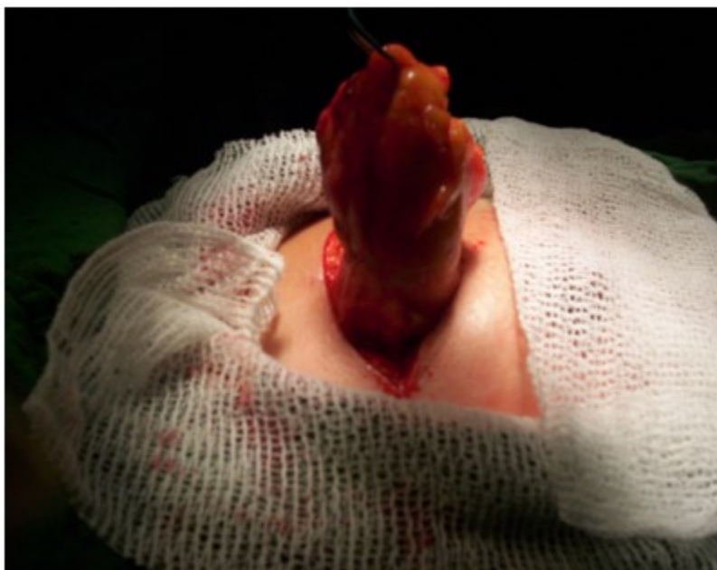
Figura 2. Momentos finales de la exéresis del tumor

Se realizó la exéresis de la tumoración con biopsia por parafina, en la cual se notificó la presencia de un tumor phyllodes benigno. (Figuras 2 y 3).