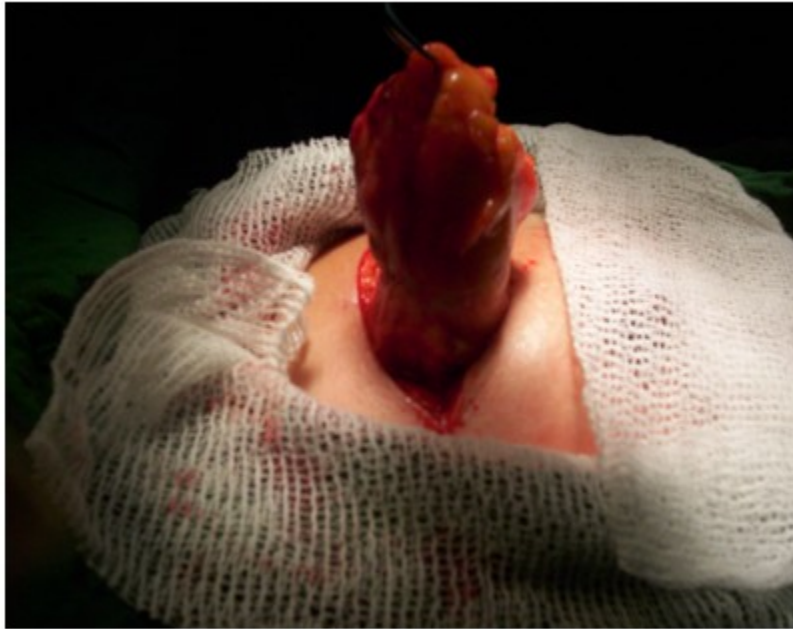
Figura 2. Momentos finales de la exéresis del tumor

Se realizó la exéresis de la tumoración con biopsia por parafina, en la cual se notificó la presencia de un tumor phyllodes benigno. (Figuras 2 y 3).