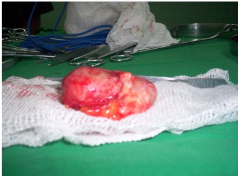
Figura 3. Tumor de 8,2 cms. ya extraído