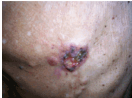
Figura 2. Vista cercana de la lesión eczematosa

Se le realizó biopsia por aspiración con aguja fina (BAAF), ultrasonido abdominal y de región mamaria y estudio radiológico de tórax. El caso fue discutido por el grupo multidisciplinario de mastología y se decidió aplicarle tratamiento quirúrgico con el diagnóstico de enfermedad de Paget de la mama con carcinoma subyacente.