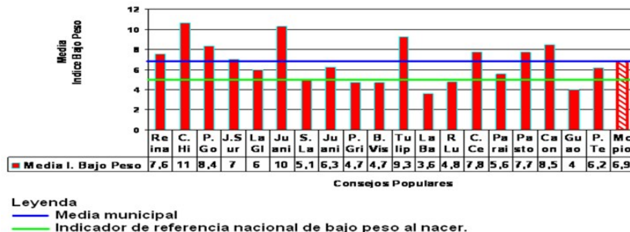
Gráfico 1: Distribución de la media del índice de bajo peso al nacer en los consejos populares del municipio Cienfuegos. Años 2003-2007

Se apreciaron algunas de las características de los estratos, que permitieron afirmar que en el estrato I considerado de bajo riesgo se encontró solo el 26,3 % de los consejos del municipio, mientras que el 68 % de los consejos se ubicaron en el estrato II y III con un alto IBPN.