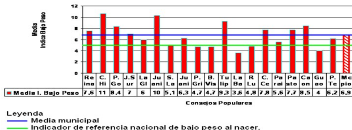
Gráfico 1: Distribución de la media del índice de bajo peso al nacer en los consejos populares del municipio Cienfuegos. Años 2003-2007

Se apreciaron algunas de las características de los estratos, que permitieron afirmar que en el estrato I considerado de bajo riesgo se encontró solo el 26,3 % de los consejos del municipio, mientras que el 68 % de los consejos se ubicaron en el estrato II y III con un alto IBPN.