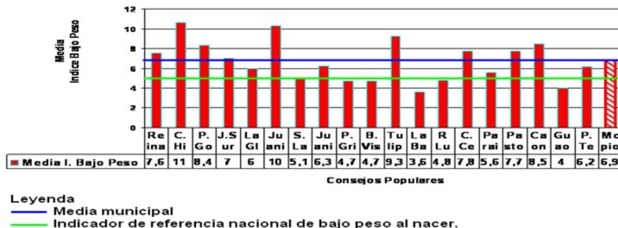
Gráfico 1: Distribución de la media del índice de bajo peso al nacer en los consejos populares del municipio Cienfuegos. Años 2003-2007

Se apreciaron algunas de las características de los estratos, que permitieron afirmar que en el estrato I considerado de bajo riesgo se encontró solo el 26,3 % de los consejos del municipio, mientras que el 68 % de los consejos se ubicaron en el estrato II y III con un alto IBPN.