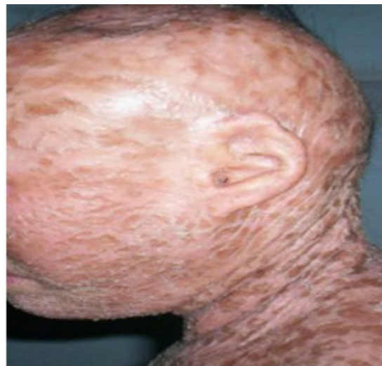
Figura 4. Se muestran otras imperfecciones

Hipoplasia de los pabellones auriculares, alopecia del cuero cabelludo, axila, pubis, cejas y pestañas de tipo cicatrizal. (Figura 4).