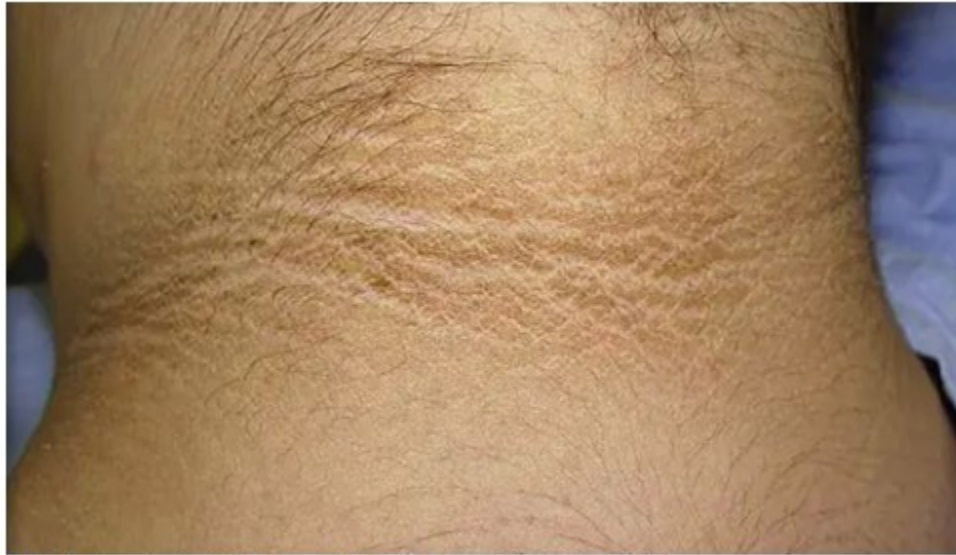
Fig. 1. Acanthosis nigricans en la región posterior del cuello

Piel: acantosis nigricans en pliegues. (Fig. 1).