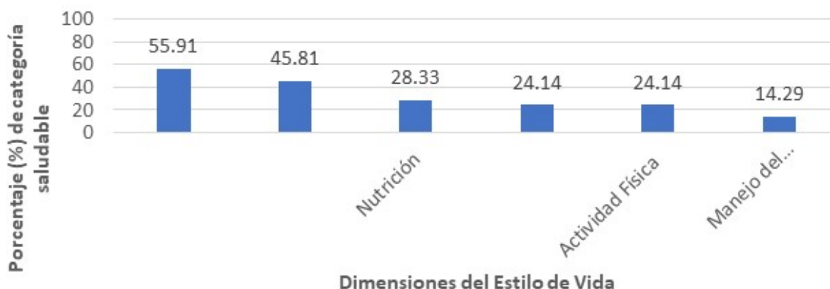
Fig. 2. Porcentaje de valoración saludable en las dimensiones del HPLP-II

meditación por 15-20 minutos diariamente” con una media de 1,37 (DE: 0,66) lo cual lo caracteriza en la opción de respuesta nunca. Se identificó que la dimensión mejor evaluada fue, Crecimiento espiritual (CE) con un 55,91 % de la muestra con hábitos categorizados como saludables, mientras, Manejo del estrés, obtuvo la peor valoración con solo el 14,29 % de los encuestados con evaluación saludable. (Fig. 2).