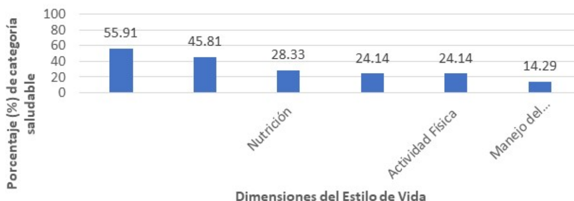
Fig. 2. Porcentaje de valoración saludable en las dimensiones del HPLP-II

meditación por 15-20 minutos diariamente” con una media de 1,37 (DE: 0,66) lo cual los caracteriza en la opción de respuesta nunca. Se identificó que la dimensión mejor evaluada fue, Crecimiento espiritual (CE) con un 55,91 % de la muestra con hábitos categorizados como saludables, mientras, Manejo del estrés, obtuvo la peor valoración con solo el 14,29 % de los encuestados con evaluación saludable. (Fig. 2).