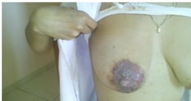
Fig. 1. Lesiones entematosas en complejo areola pezón de la mama derecha

Al examen físico se constató una placa escamosa con discreto exudado seroso que ocupaba todo el complejo areola pezón de la mama derecha. (Fig. 1).