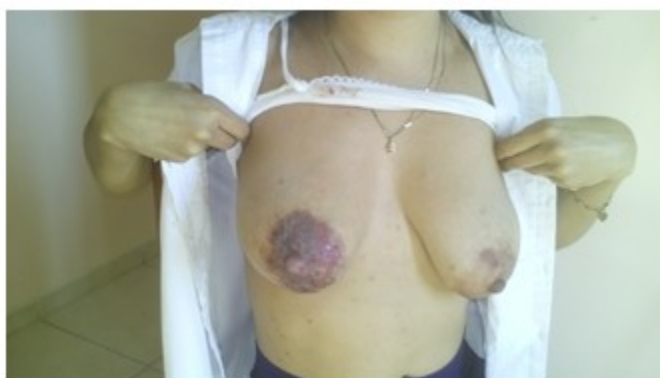
Fig. 2. Lesiones dérmicas en todo el complejo areola pezón derecho y lesiones comenzantes en la areola izquierda

areola en la mama izquierda. No se detectaron adenopatías axilares ni supraclaviculares. (Fig. 2).