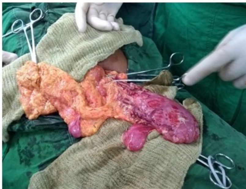
Figura 1. Pieza macroscópica

Se envió la pieza anatómica para estudio histológico (biopsia), la realización del procedimiento mostró omento mayor. Tras su estadía de 4 días en el hospital con mejoría clínica y estabilidad hemodinámica la paciente fue dada de alta hospitalaria. El estudio histopatológico de la lesión manifestó un liposarcoma mixoide hipocelular.