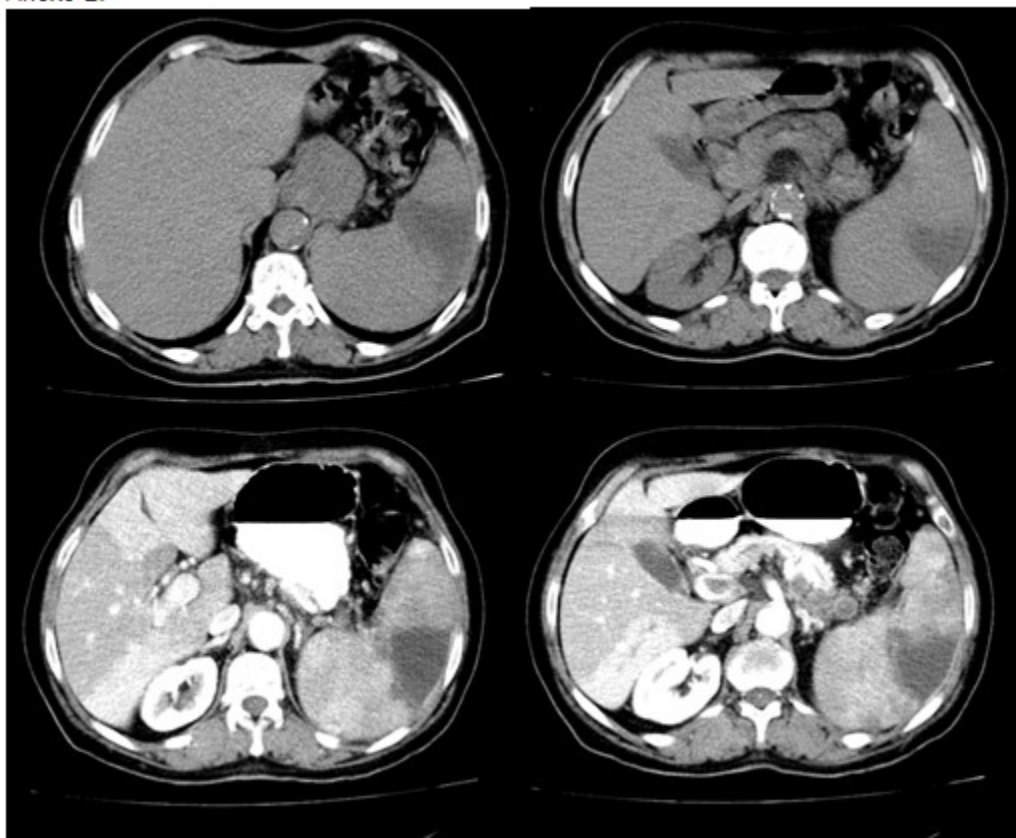
Figura 2. Tomografía con contraste donde se visualiza la extensión de la trombosis en el eje esplenoportal