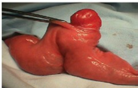
Figura 3. Fotografía de la pieza de resección intestinal. Obsérvese el nódulo tumoral metastásico.

El informe operatorio notificó una oclusión intestinal mecánica yeyuno-ileal por invaginación de 5 cms. En esa región se halló una masa nodular tumoral. Se realizó la resección intestinal con anastomosis término terminal. Se envió la pieza a anatomía patológica para su análisis. (Figura 3).