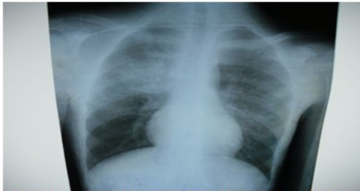
Figura 2. Imagen radiográfica que muestra opacidad homogénea, con bordes bien definidos en el hemitórax derecho.

En la tomografía axial computarizada de tórax se confirmó la presencia de una imagen en el