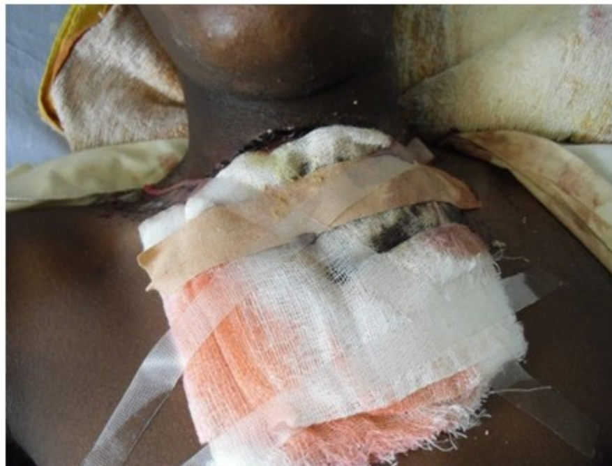
Figura 1. Imagen que muestra trayecto fistuloso a nivel del cuello que se extiende al tórax.

Se le realizó estudio de la lesión mediante el que se constató un proceso inflamatorio subcutáneo con un denso infiltrado inflamatorio que estaba constituido por linfocitos, histiocitos y neutrófilos. Se inició tratamiento con cefalexina (500 mg cada seis horas durante 15 días), pero el paciente no mejoró. Al transcurrir 24 días comenzó a padecer de fiebre elevada, tos húmeda con expectoración verdosa, sensación de opresión torácica y disnea intermitente. Al examen físico se constató: