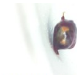
Figura 2. Se observa lesión de bordes bien definidos encapsulada de color negro

Técnica quirúrgica: con el paciente colocado en posición de plegaria mahometana modificada, se realizó asepsia y antisepsia, se colocaron paños estériles. Se planeó una incisión dorsal media desde D12 a L4, que se delimitó con comprobación radiológica y se procedió a incisión definitiva, se practicó desinserción de la musculatura paravertebral de manera estándar y se efectuó esqueletización y laminectomía del arco vertebral de L2. Se ejecutó durotomía y se visualizó una lesión que guardaba relación con raíces nerviosas a ese nivel, encapsulada, de color negro, se procedió con rizotomía, cauterizando en ambos extremos de la raíz y se realizó exéresis total de la lesión. Se realizó cierre dural, cierre por planos y se colocó drenaje de la herida. En el acto quirúrgico se siguieron todos los protocolos establecidos para la cirugía de pacientes con diagnóstico de VIH. Se envió la muestra a anatomía patológica para que fuera analizada. (Figura 2).