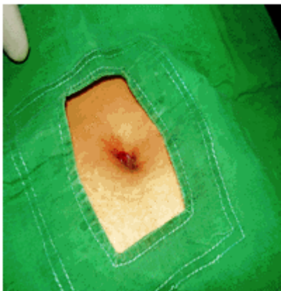
Figura 2. Imagen que sospechaba diagnóstico de una endometriosis

Se procedió a realizar laparoscopia en busca de implantes o siembras en la cavidad abdominal, sorprendiéndonos al no encontrar foco alguno en las localizaciones descritas en la literatura médica. Se confirmó el diagnóstico al realizar exéresis y biopsia de la lesión umbilical.