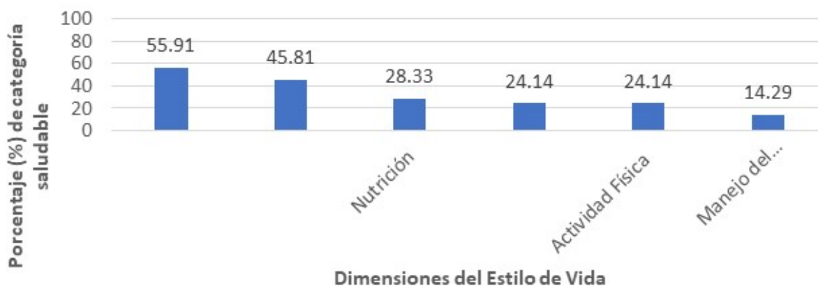
Fig. 2. Porcentaje de valoración saludable en las dimensiones del HPLP-II

meditación por 15-20 minutos diariamente” con una media de 1,37 (DE: 0,66) lo cual lo caracteriza en la opción de respuesta nunca. Se identificó que la dimensión mejor evaluada fue, Crecimiento espiritual (CE) con un 55,91 % de la muestra con hábitos categorizados como saludables, mientras, Manejo del estrés, obtuvo la peor valoración con solo el 14,29 % de los encuestados con evaluación saludable. (Fig. 2).