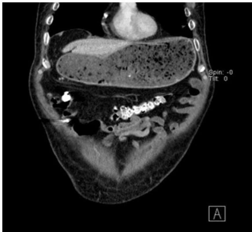
Fig. 1. Tomografía axial computarizada abdominal con contraste vía oral en corte coronal

De forma inicial, se realizó búsqueda intencionada de patología quirúrgica abdominal por lo que se solicitó la realización de tomografía abdominal contrastada, que reportó estómago a máxima repleción de contenido gastro-alimentario, unión gastroduodenal con engrosamiento circunscrito de su pared y aumento del diámetro de la primera y segunda porción del duodeno. (Fig. 1).