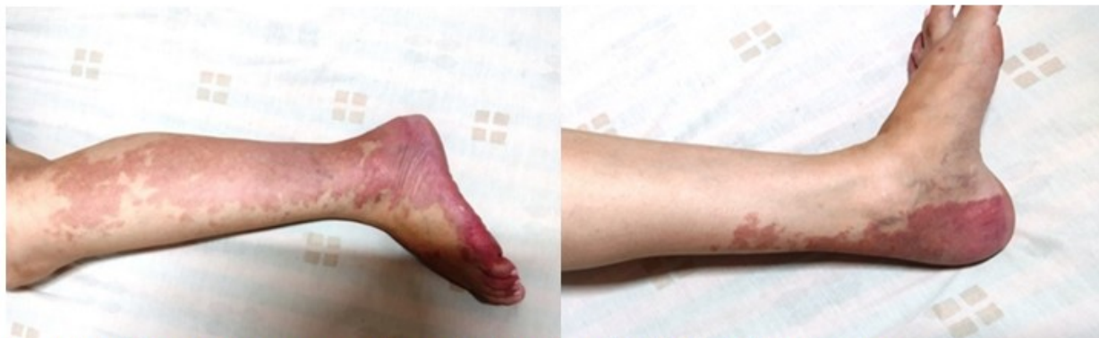
Figs. 1A y B. Se constató una extensa mancha rojo-vino homogénea, bien definida, de límites irregulares

inferior izquierdo y aumento de volumen de los tejidos blandos de dicha extremidad de consistencia blanda, suave a la palpación y no era dolorosa. (Figs. 1A y B).