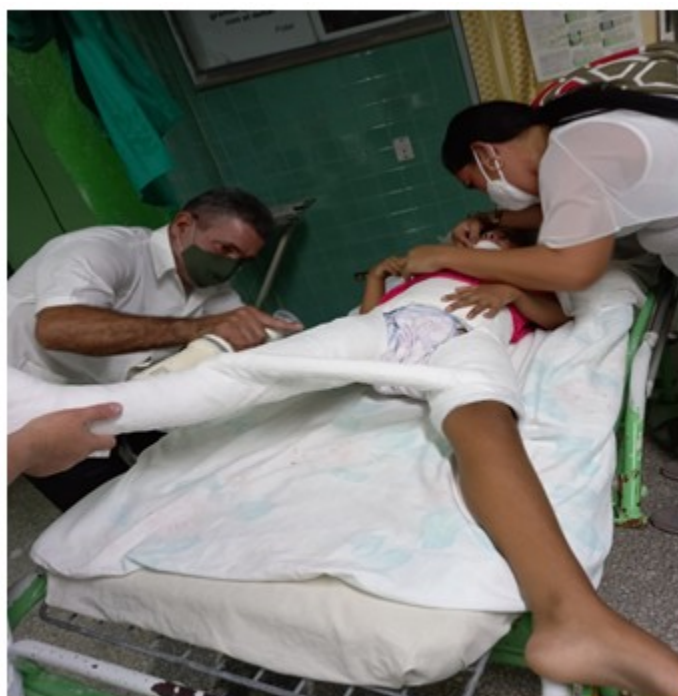
Figura 3. Se realizó fijación percutánea de yeso bajo intensificador de imagen

Se planificó la cirugía en la que se realizó reducción de la fractura bajo anestesia general y fijación percutánea de yeso, todo bajo intensificador de imagen. (Figura 3).