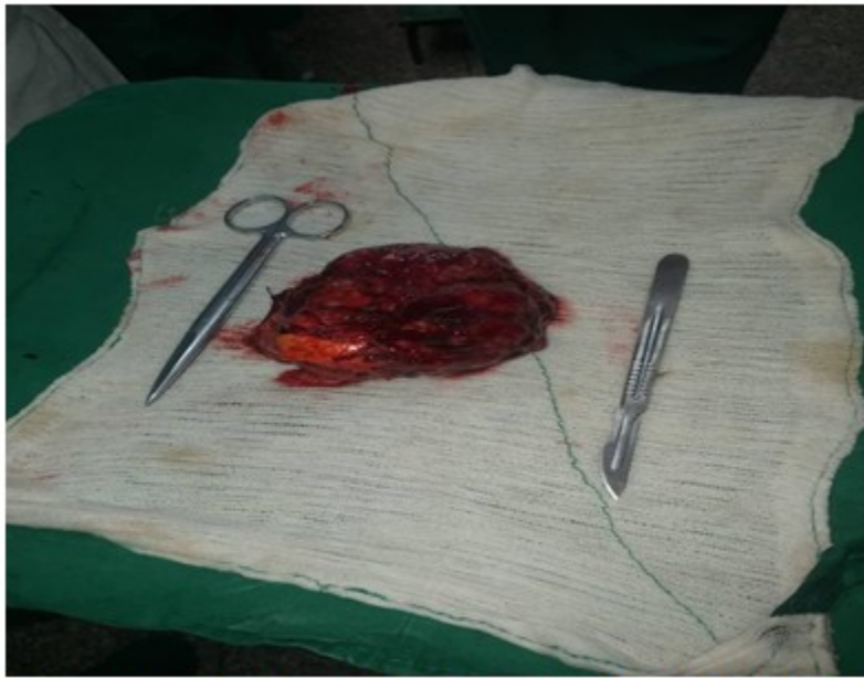
Fig. 1. Pieza quirúrgica de 10 x 9 x 6 cm correspondiente a la glándula suprarrenal izquierda

El examen anatomopatológico mostró un carcinoma adenocortical suprarrenal con