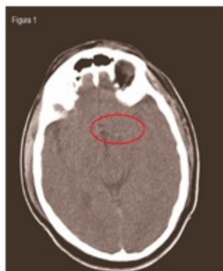
Fig. 1. TAC de cráneo simple sin contraste

La tomografía axial computarizada (TAC) de cráneo simple sin contraste mostró en los cortes tomográficos practicados a 5 mm. hiperdensidad lineal de aproximadamente 2,5 cm (54 UH) (señalizado por el "círculo rojo") en proyección del territorio de irrigación de la cerebral media (signo de la arteria cerebral media hiperdensa.), además se observó borrosidad de surcos y giros del hemisferio cerebral ipsilateral que sugerían edema cerebral difuso que provocó ligero colapso del ventrículo lateral a predominio del asta anterior. (Fig. 1).