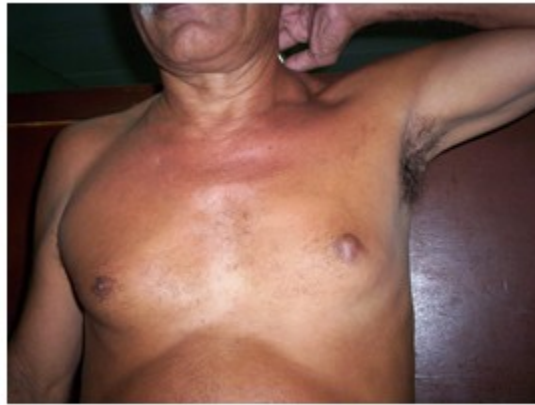
Figura 1. Paciente con tumor areola izquierda

anterior que acudió a la consulta provincial de mastología por presentar una tumoración ulcerada, en la región areolar de la mama izquierda, sin adenopatías axilares acompañantes de 4 meses de evolución. (Figuras 1 y 2).