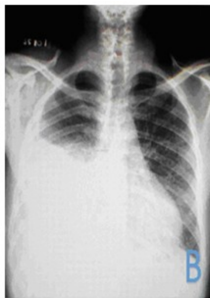
Fig. 1B. Radiografía posterior a toracocentesis

Se orientó además realizar ultrasonido abdominal y de bases pulmonares que corroboró derrame pleural derecho, de mediana a gran cuantía, con escasa celularidad y no tabicado. Posteriormente, se practicó toracocentesis. Se le realizó radiografía posterior a toracocentesis. (Fig. 1B).