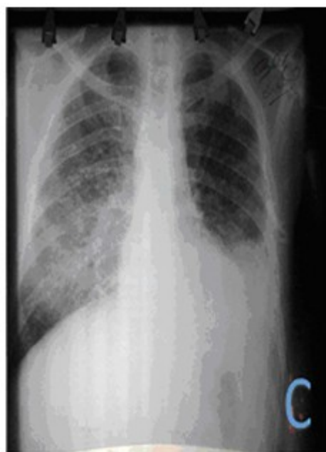
Fig. 1C. Radiografía actual, posterior a tratamiento

El caso de este paciente se ha seguido en consulta en la que se ha realizado radiografía posterior al tratamiento. Se mantiene en la actualidad con tratamiento citostático y seguimiento. (Fig. 1C).