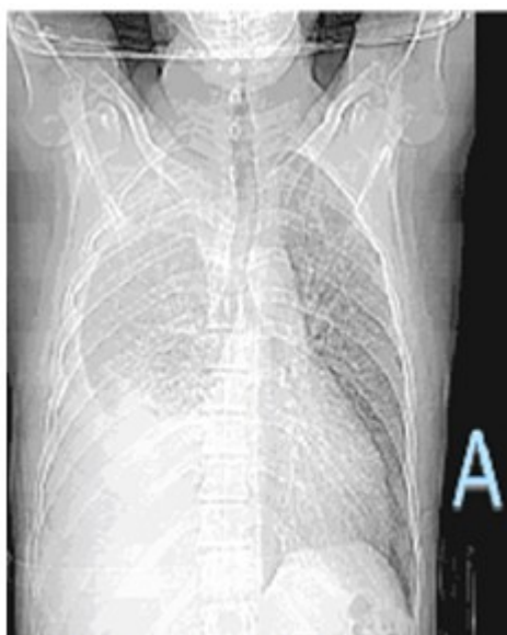
Fig. 2A. Radiografía de tórax evolutiva que no mostró mejoría radiológica

Se decidió realizar tomografía axial computarizada en la que se observó retículo pulmonar grueso en campos pulmonares, con derrame pleural de pequeña cuantía izquierdo y de mediana a gran cuantía derecho, pequeñas adenopatías mediastínicas y axilares bilaterales, cambios en la densidad ósea en las primeras vértebras dorsales y pequeñas imágenes hipodensas redondeadas en el hígado. (Fig. 2B y C).