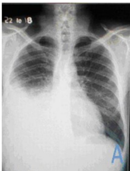
Fig. 1A. Radiografía realizada anterior al ingreso

A tenor de lo antes expuesto, se decidió su ingreso en el Servicio de Medicina Interna para estudio y tratamiento médico. El diagnóstico presuntivo fue el de neumonía adquirida en la comunidad, no grave, complicada con un derrame pleural derecho. Durante su estadía en sala, se ampliaron los estudios hemoquímicos. (Tabla 2).