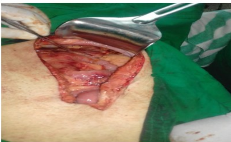
Figura 4. Imagen que muestra pared anterior del estómago suturada

Se realizó la técnica quirúrgica de Juracz , una cistogastrostomía. El paciente lleva 1 año operado con evolución favorable.