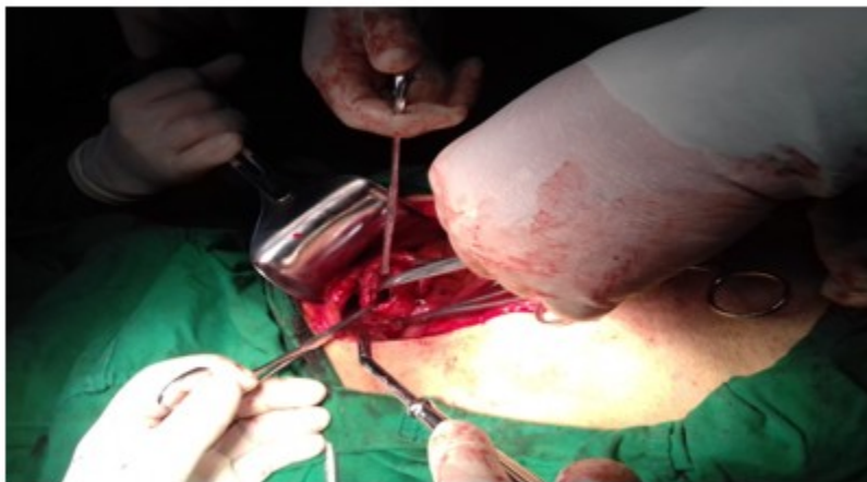
Figura 3. Imagen que muestra apertura de la pared posterior del estómago