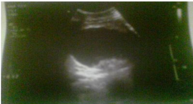
Figura. 1 Imagen ecolúcida sugestiva de pseudoquiste de páncreas por UTS abdominal

Rayos (Rx) de tórax AP: sin alteraciones en partes óseas. Se observó un pequeño derrame pleural bilateral. Sin lesiones mediastinales. Índice cardiotorácico normal.