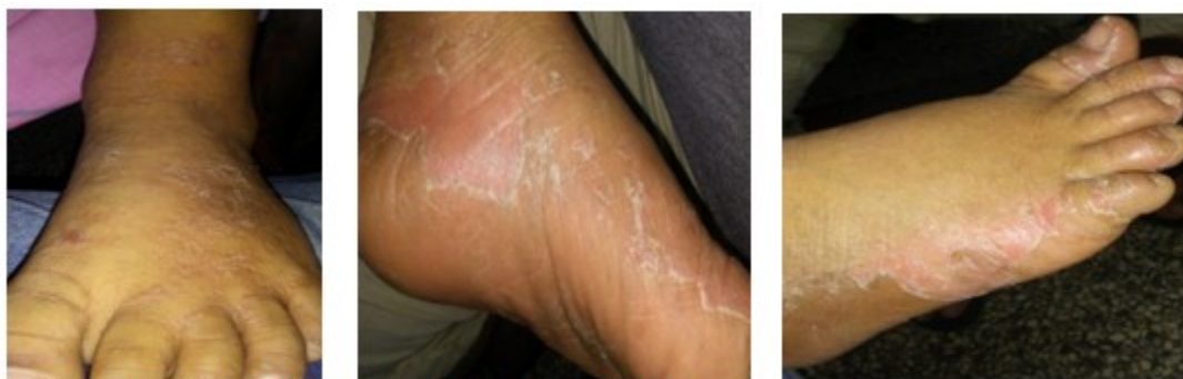
Figuras 4, 5 y 6. Imágenes de la progresión de las lesiones

A pesar de que la literatura revisada afirma que la erupción puede reaparecer mientras circulen metabolitos activos del fármaco en sangre, se consideran un grupo de pacientes acetiladores lentos en los que este hecho es más evidente. (Figuras 4,5 y 6).