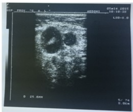
Figura 3. Ultrasonido de la región axilar derecha

adenomegalias, la mayor de 25 mm. y aspecto metastásico. (Figura 3).