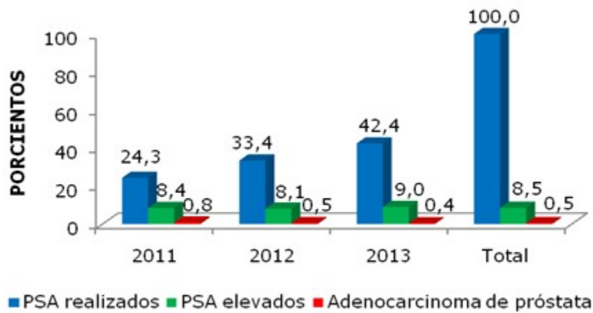
Gráfico 2. Rastreo de los resultados, relacionando los PSA realizados, los elevados y adenocarcinoma de próstata por año

los tres años, de estos pacientes examinados se demostró la presencia de adenocarcinoma de próstata en el 0,5 %. (Gráfico 2).