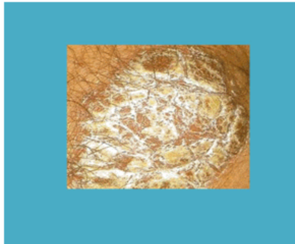
Figura 1. Placa eritematoescamosa en codos y rodillas

Los antecedentes personales y hereditarios, la