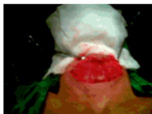
Figura 2. Tumor del cuello expuesto

Se procedió a la intervención quirúrgica de la paciente con exéresis de la tumoración, que fue informada por el departamento de anatomía patológica como un bocio multinodular. (Figuras 2, 3, 4,5).