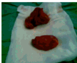
Figura 5. Ambas tumoraciones resecaadas