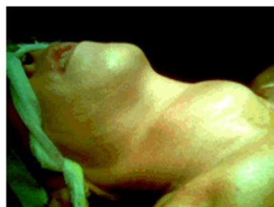
Figura 1. Paciente con tumor de cuello

Se presenta el caso de una paciente de sexo femenino, de 59 años de edad que refirió haber presentado desde hacía 2 años aumento de volumen del cuello, acompañado de decaimiento, palpitations y disfagia. Al examen físico se constató la presencia de una tumoración que ocupaba la región antero-inferior y lateral derecha del cuello, movable, que se prolongaba hacia abajo a la parte superior del tórax. (Figura 1).