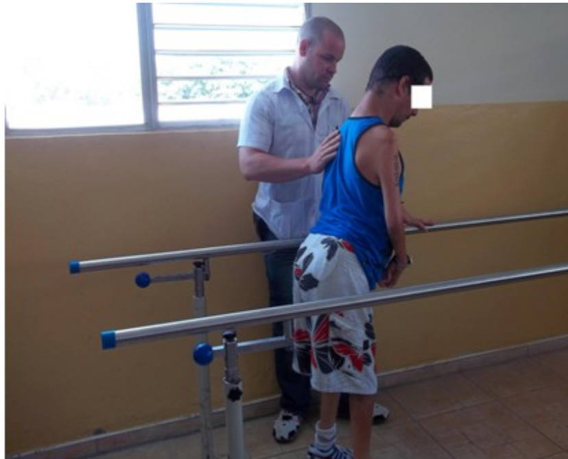
Figura 2. Entrenamiento de marcha entre paralelas

Después de un mes ya el paciente no tenía signo alguno de inflamación, se ganó 250 en la flexión de rodilla, quedó solo una diferencia de apenas 4 cm de la masa muscular del muslo derecho en comparación al izquierdo, se logró la bipedestación sin ayuda. (Figura 2)