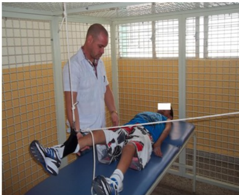
Figura 3. Ejercicios fortalecedores en la Jaula de Rocher

Luego de otro mes de terapia el paciente logró la marcha dinámica e incluso era capaz de subir y bajar escaleras y se decidió dar el alta, siempre