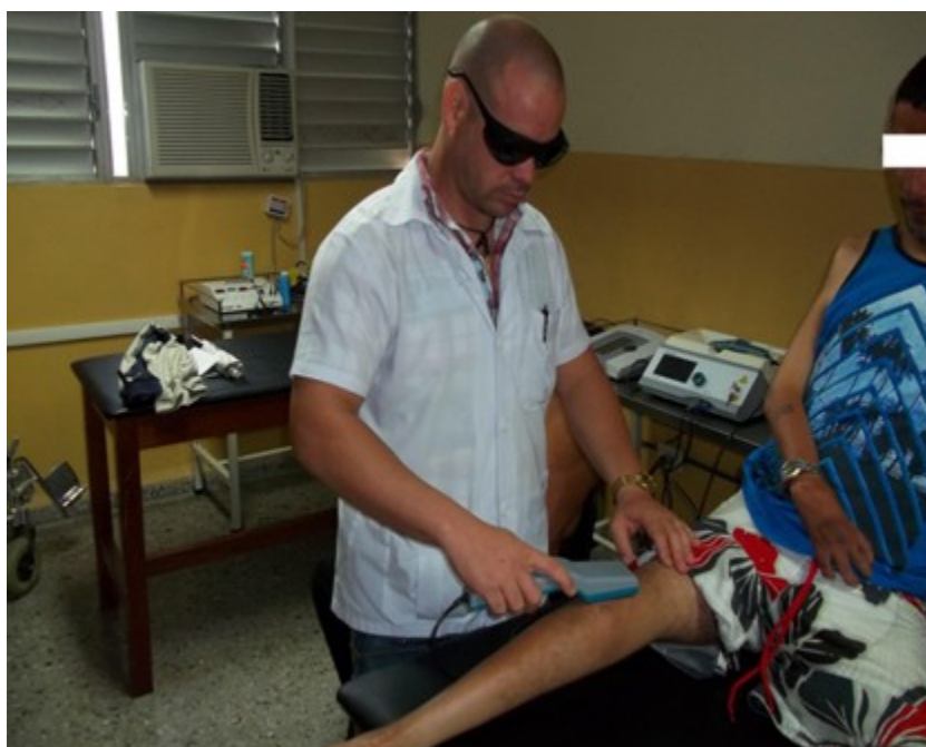
Figura 1. Tratamiento con láser

Se inició primeramente la aplicación de la laserterapia en dos sesiones diarias como catalizador, para aumentar el proceso de cicatrización, disminuir el edema y el dolor por su efecto analgésico y antiedematoso. 7 (Figura 1).