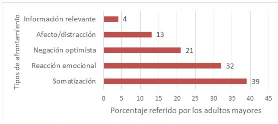
Gráfico 1. Distribución de los pacientes según los principales afrontamientos

En cuanto a la evaluación de la ejecución de la intervención educativa. Se registraron cambios en los estilos de afrontamiento, luego de la intervención. Este hecho que se relaciona con su efectividad. En la última sesión, en un 42 %, los adultos mayores se encaminaron hacia la búsqueda de información relevante, sin embargo, en la primera sesión, solo un 4 % habían movilizado su comportamiento en este sentido.