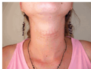
Figura 2. Paciente luego de la operación.

Mediante cirugía por técnica convencional, se extrajo el tumor. (Figuras 2 y 3)